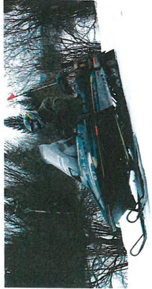
Les motoneiges ne peuvent être utilisées hors circuit homologué.